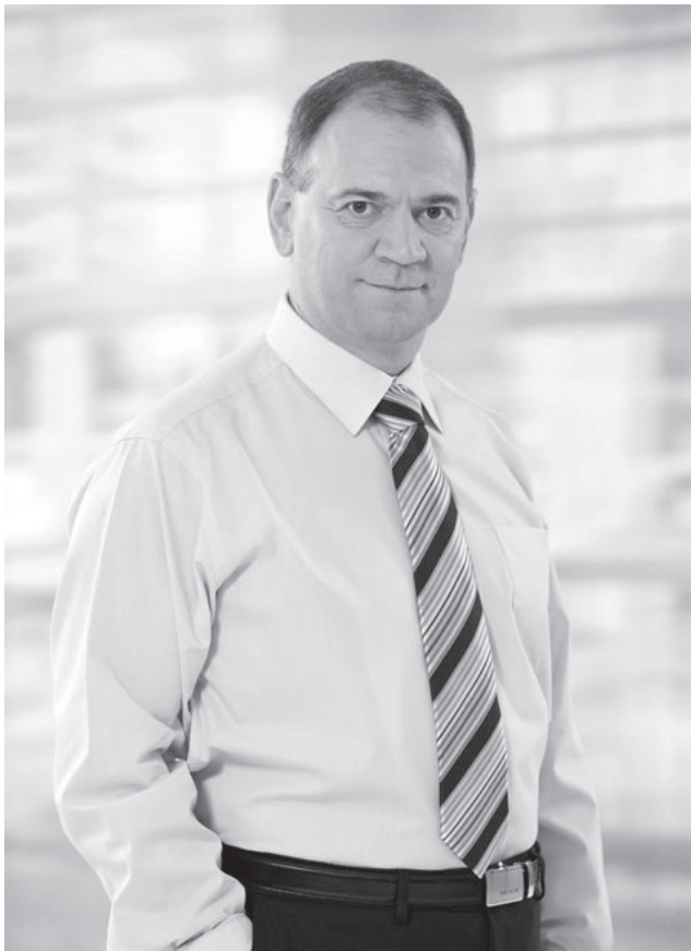
Márton Attila Országgyűlési képviselő FIDESZ

Köszönöm az eltelt több mint másfél évtizedben kapott bizalmat, a segítő és jobbitó szándékú kritikákat, az aktivisták odaadó, fáradhatatlan munkáját!